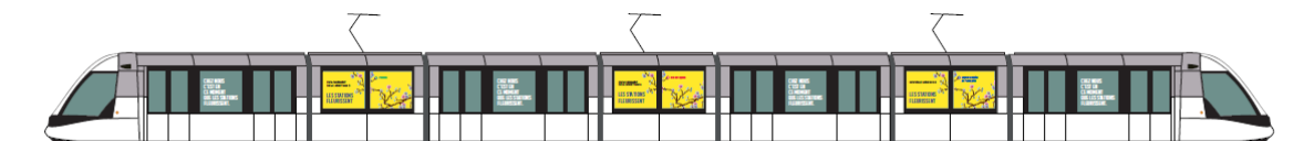
Habillage 10 rames Citadis