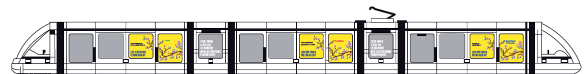
Habillage 10 rames Eurotram